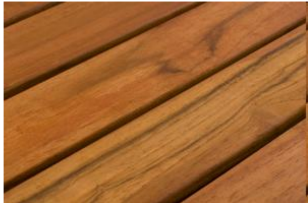
TEAK- spårad yta.