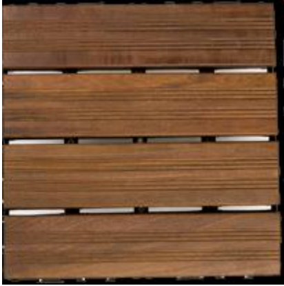
IPE- spårad yta.